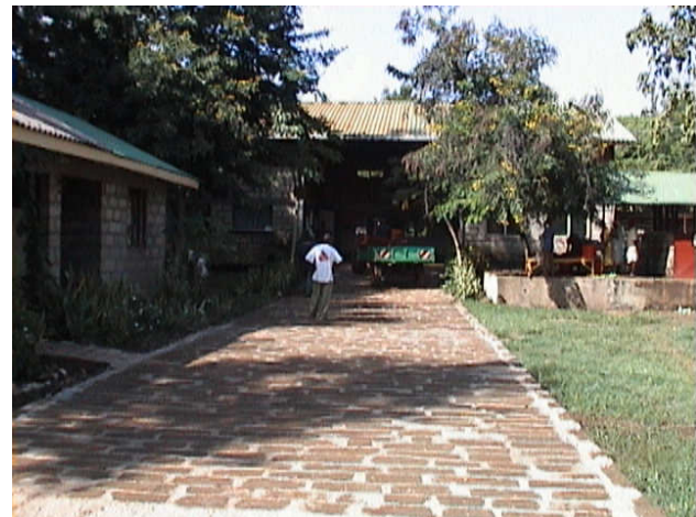
Nelle due foto la situazione del campo prima e dopo la pavimentazione.